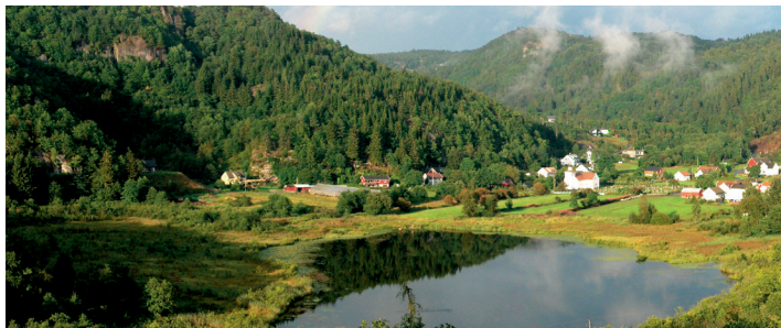
Blick aus dem Wohnzimmer

Obergeschoss: Hier befindet sich ein großer Wohn-/Essraum mit offener Küche. Der Wohnraum ist mit Fernseher (deutsche Sender), sowie Radio ausgestattet, Internetzugang vorhanden. Küche mit 3 Pl. E-Herd mit Backofen, Dunstabzug, Mikrowelle, Kühlschrank, Kaffeemaschine, Toaster, Mixer und warm und kalt Wasser. Essplatz für 6 Personen. Es gibt drei Schlafzimmer. Einmal mit Doppelbett, einmal mit Doppelbett und einem Einzelbett, sowie eine Schlafkammer mit einem Dachfenster und einem Einzelbett. Die Zugangstür zur Schlafkammer hat infolge der Dachschrägen Untermaß. Erdgeschoss: Hier befinden sich der Eingangsbereich mit Garderobe, großer TK-Truhe, ein Badezimmer mit Dusche und WC, sowie ein Waschraum mit Waschmaschine. Das Haus ist individuell und geschmackvoll eingerichtet. Am Haus gibt es eine Sitzterrasse mit Grill. Eine zweite Terrasse mit Blick auf den See steht ebenfalls zur Verfügung. Der wunderschön angelegte Garten der Eigentümer kann mitbenutzt werden.